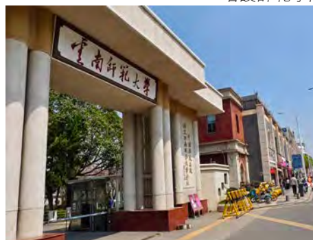
雲南師範大學門前標明是西南聯大舊址