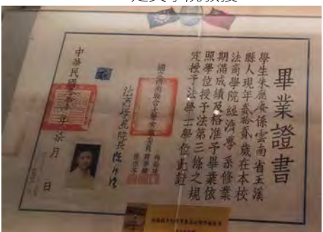
1944年頒的畢業證書上， 有三位校長的印章。