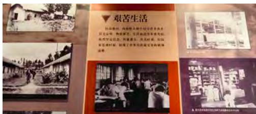
舊照片顯示當年生活艱苦

和平後，西南聯大於1946年5月結束。不過，校址沒有荒廢，而是將戰時才開辦的師範學院擴充，後來成為雲南師範大學，延續教育這個神聖任務。◇