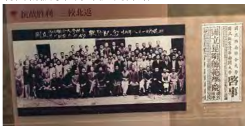
西南聯大結束，同時昆明師範學院成立。