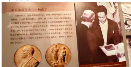
有關楊振寧與李政道的介紹