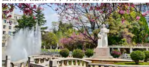
春天的雲南師範大學校園很美麗