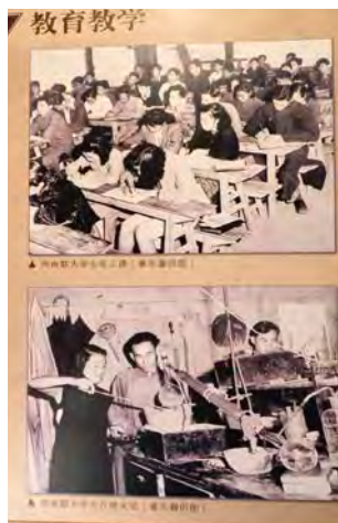
當年簡陋的課室和實驗室