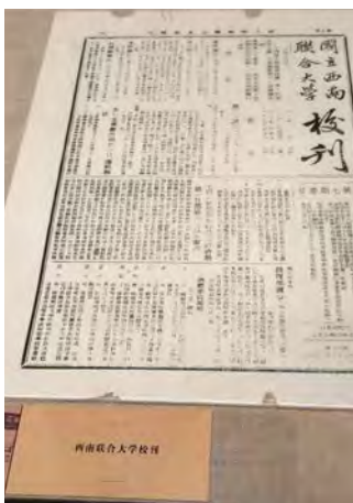
第七期校刊敘述大學增設師範學院