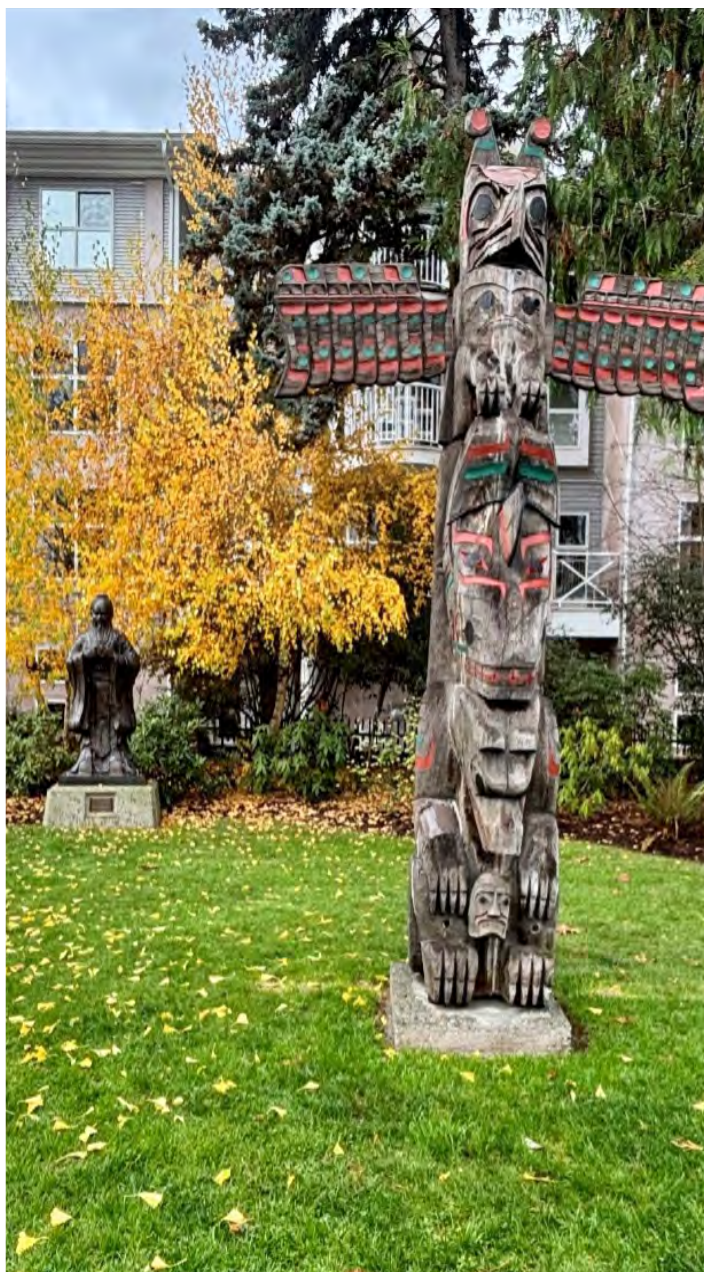
孔子像和圖騰柱Pole of Wealth by Simon Charlie

三文魚、海狸，及不常見的青蛙，形狀栩栩如生，活靈活現。在接近行程終結時，我們還發現了一座孔子像，屹立在幾根圖騰柱旁，石像與木柱互相輝映，實在帶來小小驚喜。