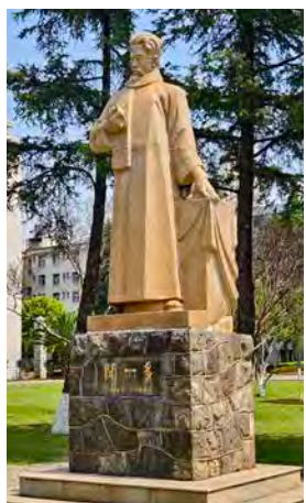
著名文學家聞一多 是文學院教授