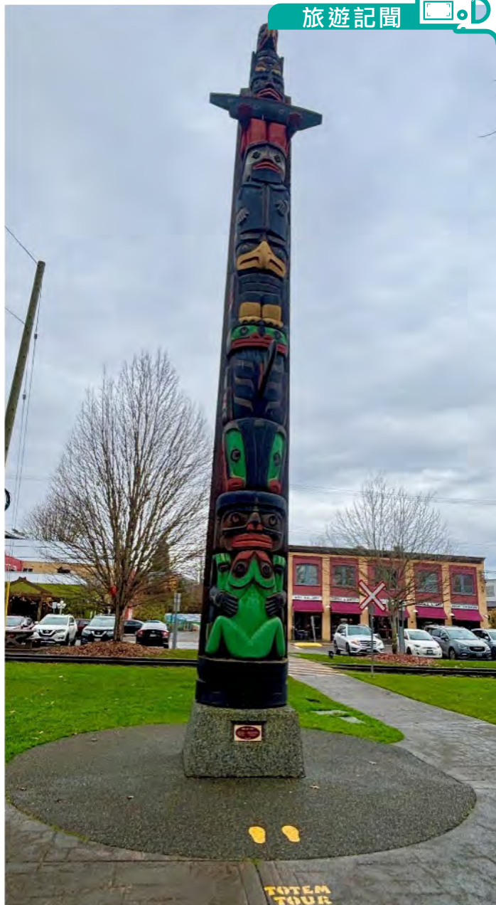
圖騰柱Centennial by Calvin Hunt

泊岸後，防衝鐵欄打開，跳板慢慢放下，卡在車軌前防止移動的木頭被拿開，一切就緒。水手用電筒照明示意開行，我們啟動汽車，踏上跳板前進。當時我有一種先鋒領航的感覺，心情極為澎湃。