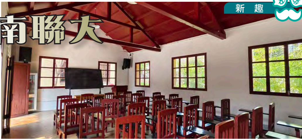
模擬課室是按照舊照片而建

中國首位（與李政道）獲頒諾貝爾獎的物理學家楊振寧最近去世，享年103歲。他一生的經歷與成就豐盛，不過筆者想說的，是他曾就讀的西南聯大。